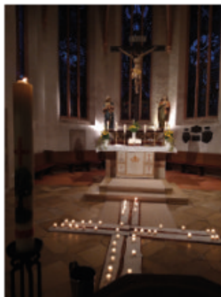
Osternacht 2026