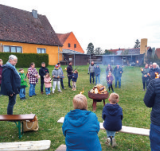
Osterfeuer 2026 - das Feuer ist entzündet

Ganz unterschiedlich geprägte Höhepunkte eröffneten viele Möglichkeiten, die Ostertage zu etwas Besonderem werden zu lassen. Gesang und Stille prägten den Karfreitag.